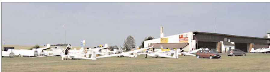
R rigtig mange transportvogne og fly befolkede pladsen i Vrchlabi.

Torsdag var igen flyvedag. Der blev dog ikke startet så tidligt. Jeg startede kl. 12:40. Vi fløj 325 km med en hastighed på 101,07 km/t, hvilket jeg er godt tilfreds med. Dagens største højde 2902 m.