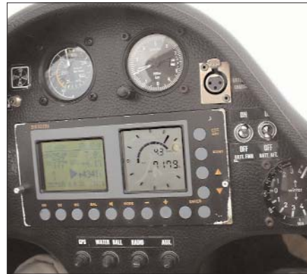
Billedet viser højde og stig

Vi kom i luften kl. 11:40 og landede igen kl. 16:17. Vi fløj kun 153 km med 67 km/t, så det var næsten som hjemme, blot var højden mellem 1200 og 2200 m.