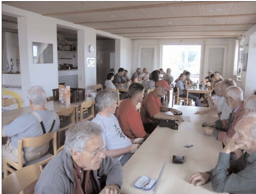
Herover: Briefing i Lüsse

Området er et fuglereservat, hvor der angiveligt skulle kunne forekomme fugle af arten "Grosstrappen", som menes at være Nordeuropas største flyvende fugl. Ingen har ganske vist nogensinde observeret disse fugle i reservatet - alligevel må området ikke overflyves i mindre end 2000'. Det skal man så lige være opmærksom på.