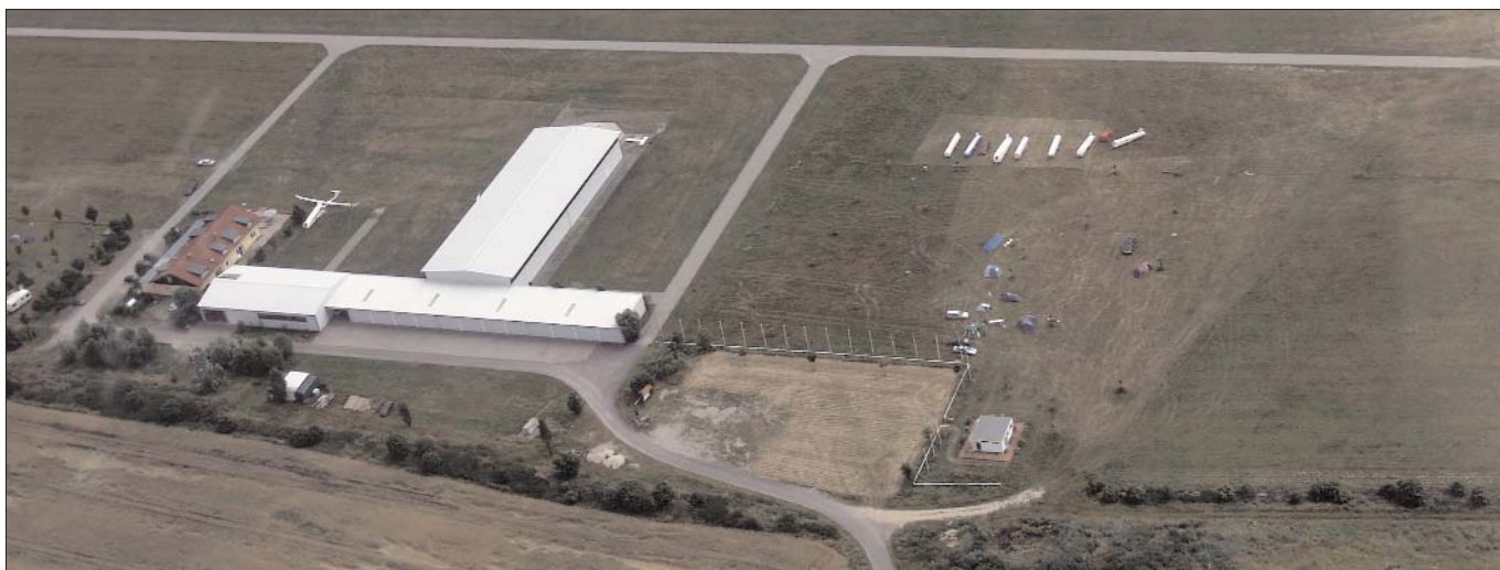
Flyvepladsen i Lüsse med RK-lejren til højre