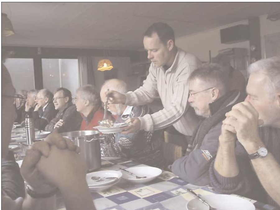
Efter hårdt og især koldt arbejde i hangaren gør varm suppe godt.

Lad os håbe, at denne sæsonstarts vejr var den såkaldte dårlige generalprøve på den kommende sæsons flyvevejr, som derfor må blive ganske fremragende med mange særdeles interessante temper.