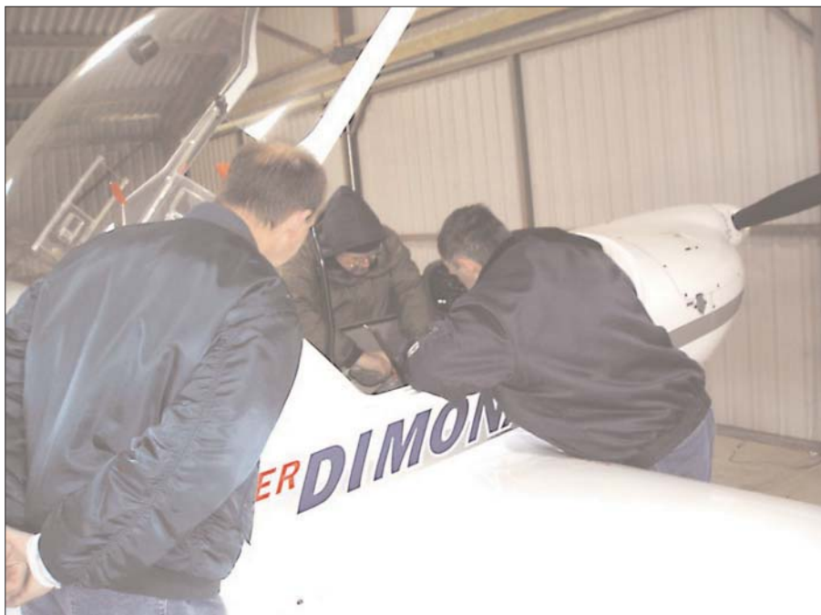
Man skal ikke springe ud i samling af fly uden grundig drøftelse.

Formanden satte alle i gang, og i løbet af 0,5 (nul-komma-fem) var der gang i sagerne.